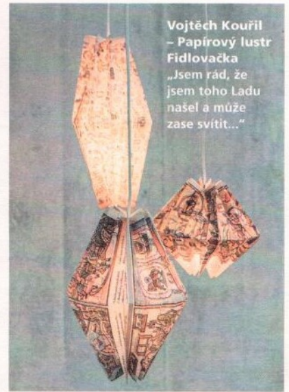
Vojtěch Kouřil – Papírový lustr Fidlovačka „Jsem rád, že jsem toho Ladu našel a může zase svítit...“